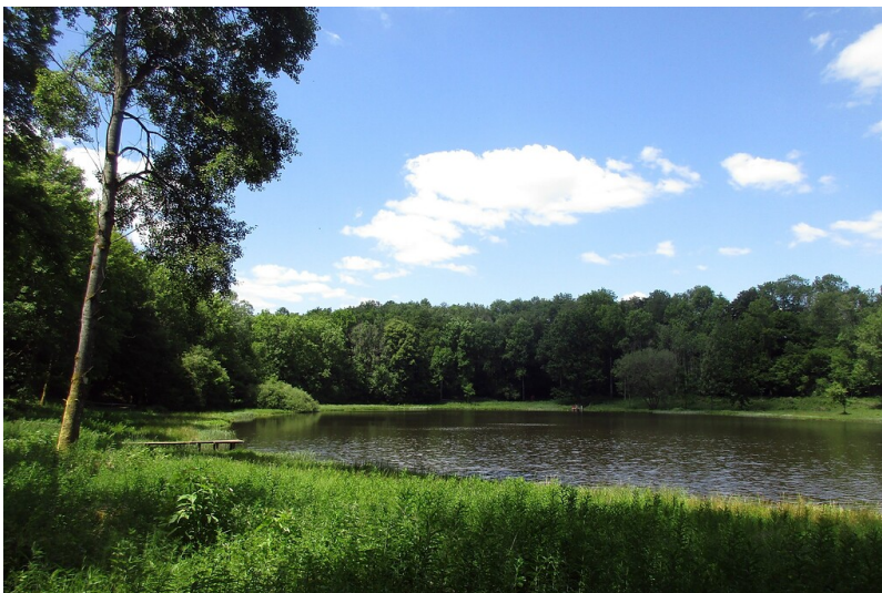
Der Windsborn-Kratersee, auch "Windsbornmaar" genannt, in der Vulkangruppe des Mosenbergs bei Bettenfeld in der Eifel (2020).