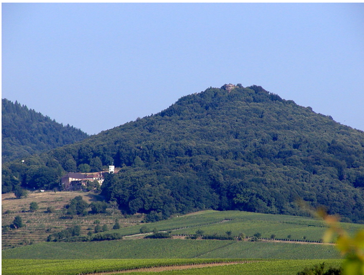
Geamtansicht von Osten