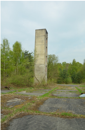
Biotopverbund Westwall - Biotopturm (2013)