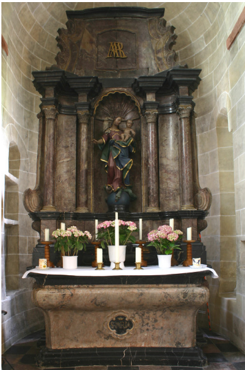
Marienaltar in der St. Lubentiuskirche zu Dietkirchen (2005)