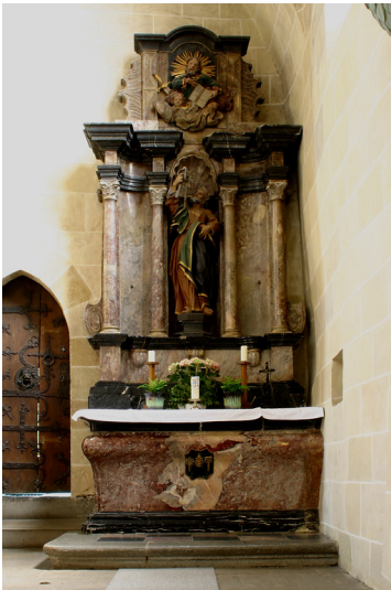
Petrusaltar in der St. Lubentiuskirche zu Dietkirchen (2005)