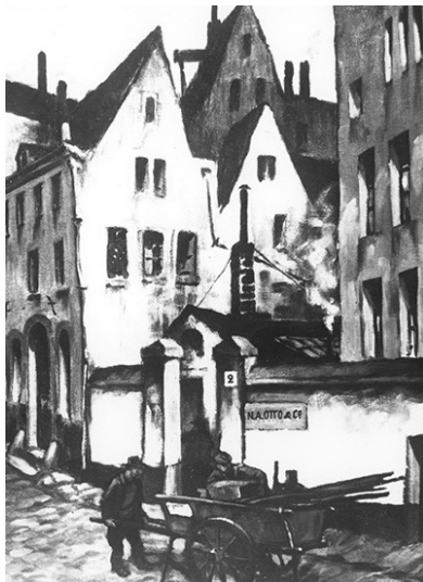
Undatierte Zeichnung des Fabrikationsgebäudes der Firma N. A. Otto & Cie. in der Servasgasse Nr. 2 in Köln.