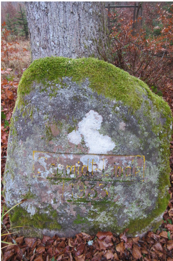
Gedenkstein „Schmidt-Linde“ 1933 am Legelbach (2018)