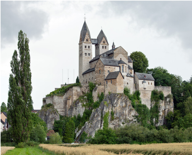
Kirche Sankt Lubentius in Limburg-Dietkirchen von Osten aus gesehen (2012)