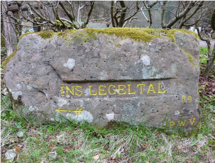
Ritterstein Nr. 96 Ins Legeltal am Legelbach bei Elmstein (2013)