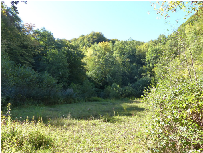
Sohlengrund in der Tongrube Oberael (2018)