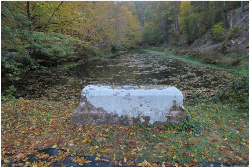
Alter Schmelzwoog am Legelbach (2018)