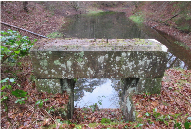
Damm und Auslaufbauwerk am Kleinlegelbacher Woog am Legelbach (2018)