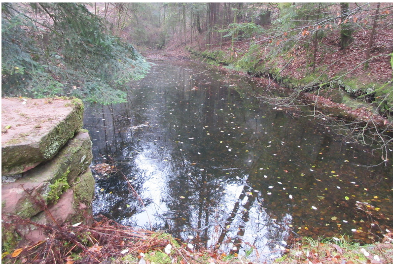
Gandertwoog mit Mönch am Legelbach (2018)