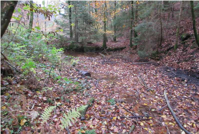
Franzenwoog am Legelbach (2018)