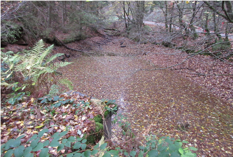
Heinrichswoog am Legelbach (2018)