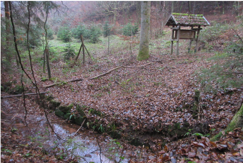
Holzbollerplatz am Legelbach (2018)