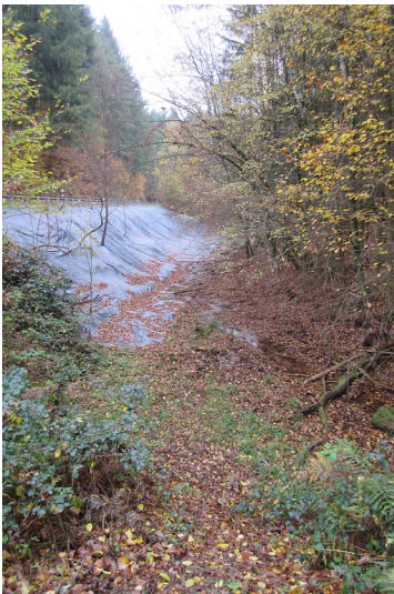
Großer Woog am Legelbach (2018)