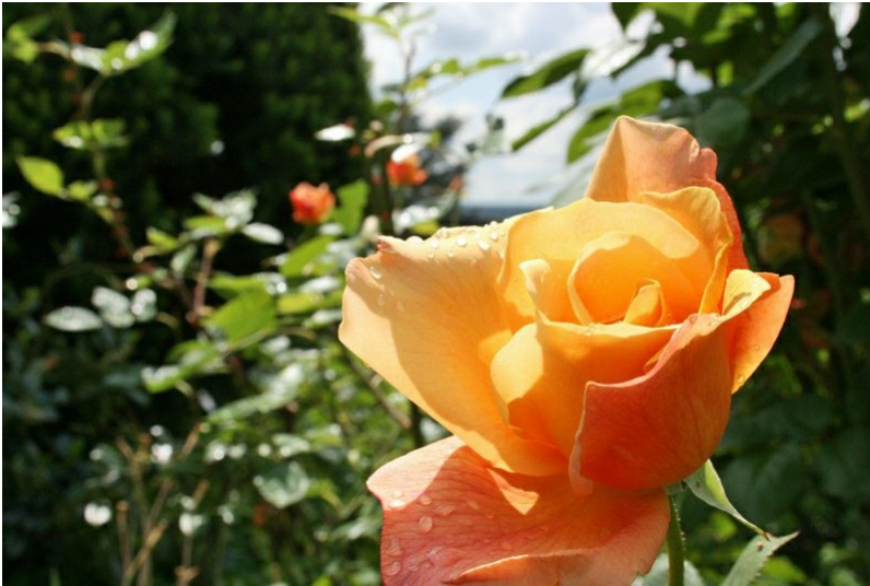
Detail einer Rosenblüte im Adenauer-Garten in Rhöndorf (2010).