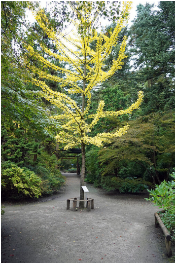
Herbstlicher Ginkgo-Baum im Forstbotanischen Garten in Köln-Rodenkirchen (2021)