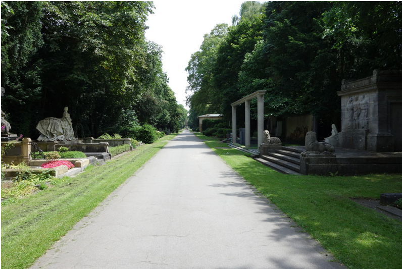
Ein Weg auf dem Friedhof Melaten in Köln (2016)