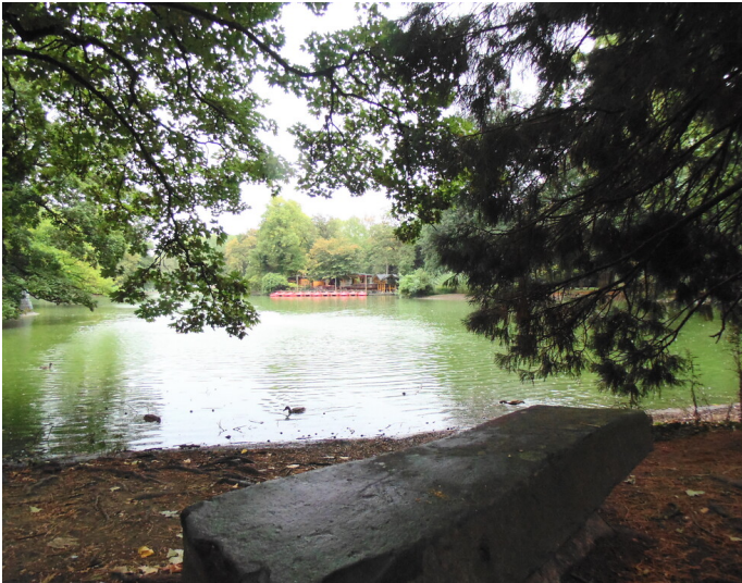
Blick auf den Kahnweiher im Volksgarten in der Kölner Neustadt-Süd (2020)