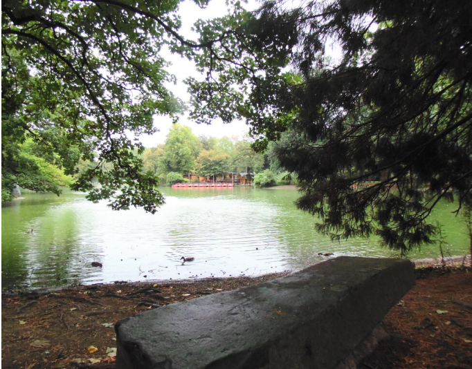
Blick auf den Kahnweiher im Volksgarten in der Kölner Neustadt-Süd (2020)