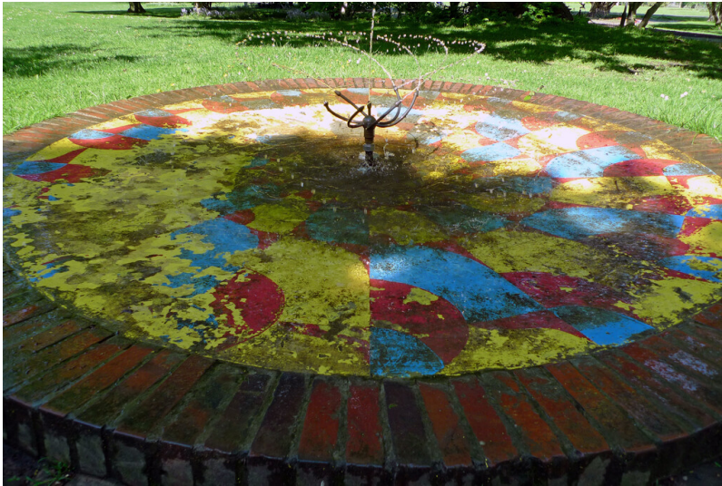
Köln Rheinpark