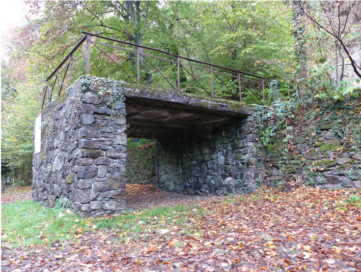
Laderampe des Steinbruchs bei Wietsche im Murbachtal (2018)