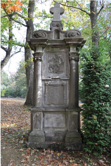
Ansicht auf die zwölfte Station des Petersberger Bittwegs gen Nordosten (2018)