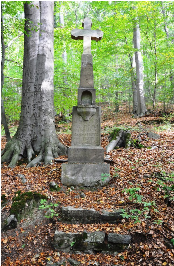
Ansicht des sechsten Wegkreuz des Petersberger Bittwegs (2018).