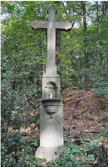
Ansicht des fünften Wegkreuzes des Petersberger Bittwegs in nördliche Blickrichtung (2018).