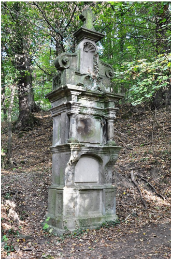
Ansicht der vierten Station des Petersberger Bittwegs in nördliche Blickrichtung (2018).