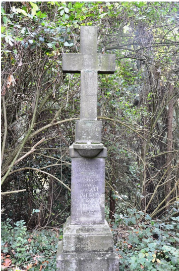
Ansicht des vierten Wegskreuzes des Petersberger Bittwegs (2018).