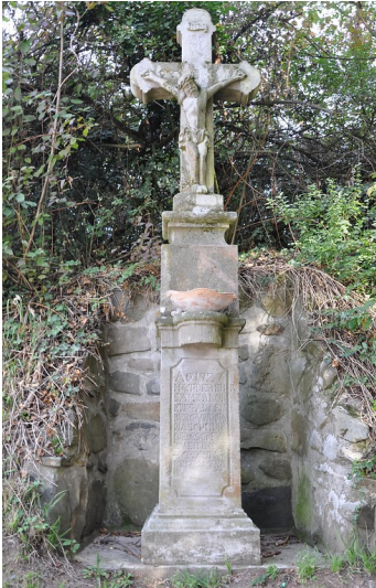
Ansicht des zweiten Wegkreuzes des Petersberger Bittwegs in nördliche Blickrichtung (2018).