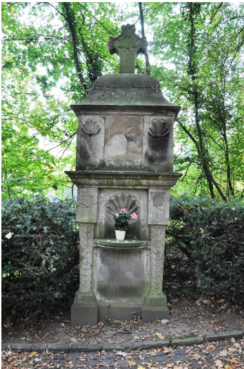
Aufnahme des Wegekreuz der ersten Station des Petersberger Bittwegs (2018).