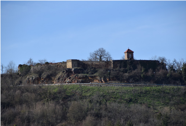
Burgruine Battenberg von Osten