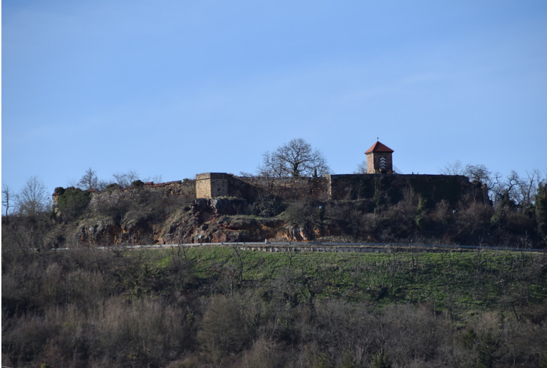
Burgruine Battenberg von Osten