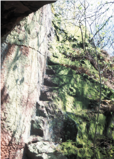
Treppe zur Oberburg