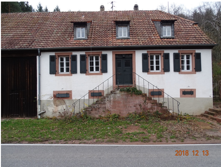
Steigerhaus Erzwesche bei Niederschlettenbach (2018)