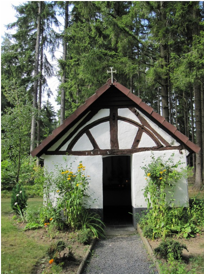
Waldkapelle Oberelz (2009)