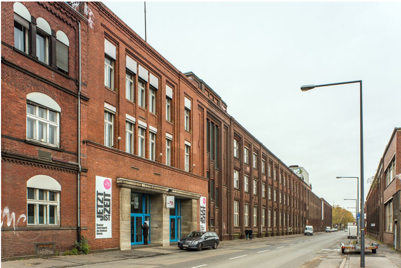
KHD Deutz Straßenansicht (2009)