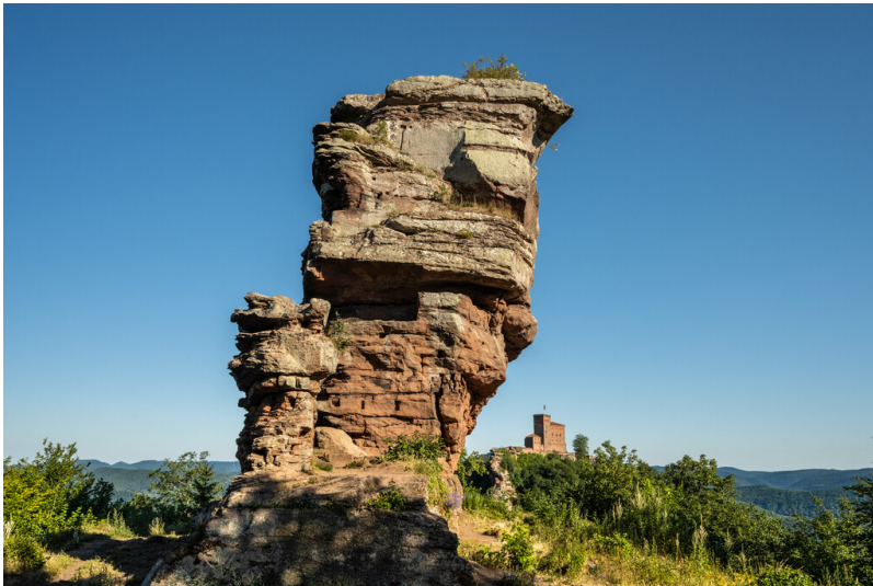
Burgruine Anebos auf dem Sonnenberg