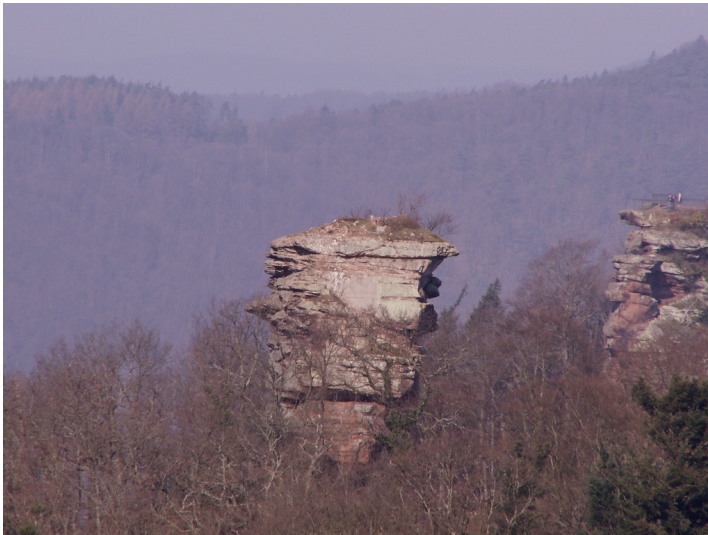
Burgruine Anebos von Westen