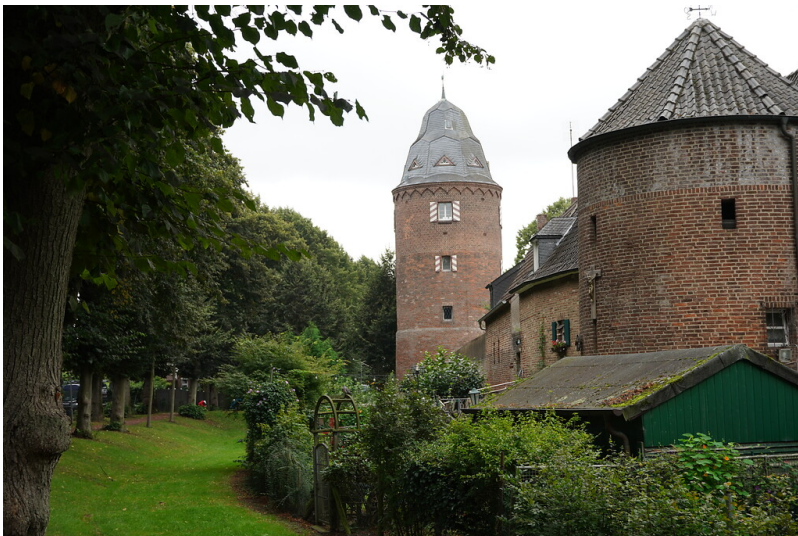
Die Stadtmühle Kranenburg und der ehemalige Außenwall der Stadtbefestigung Kranenburgs (2021).