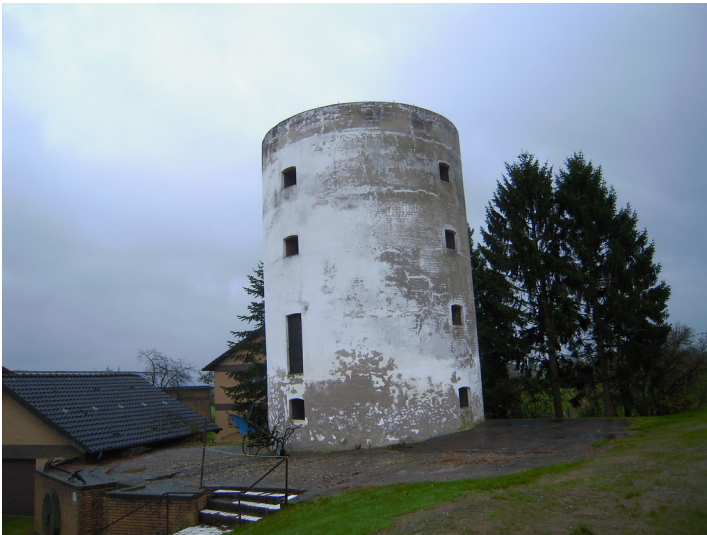
Alter Wehrturm, später Windmühle Rosau (2015)