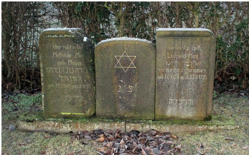
Grabsteine auf dem jüdischen Friedhof in Niedermendig (2018).