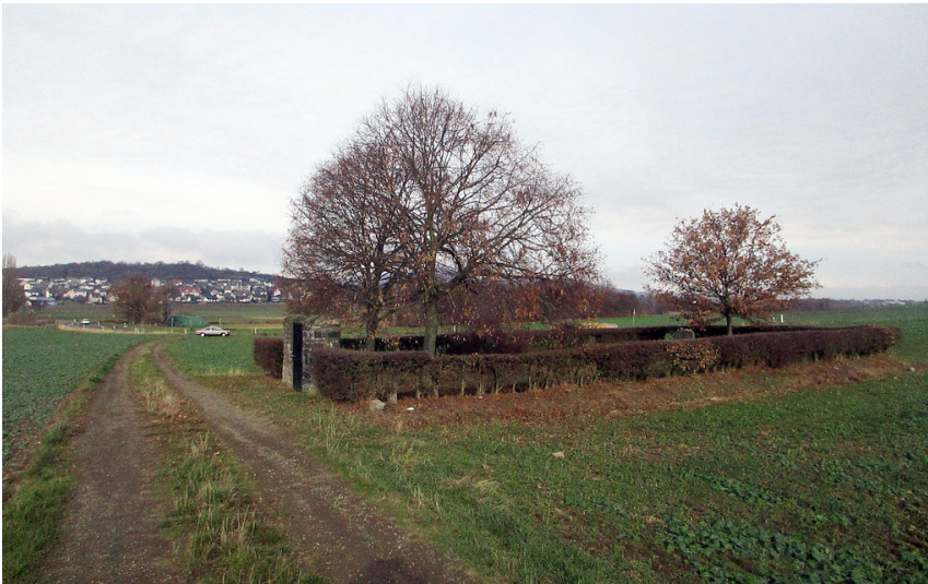
Jüdischer Friedhof Thür, im Hintergrund der Ort Thür (2018)