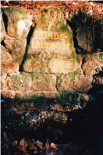
Ritterstein Nr. 166 Hundsbrunnen bei Hochspeyer (2000)