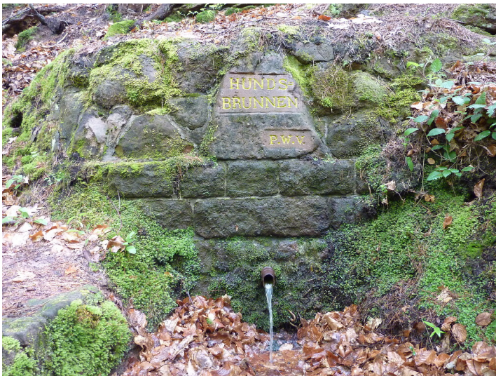
Ritterstein Nr. 166 Hundsbrunnen im Hundsbrunnertal (2014)