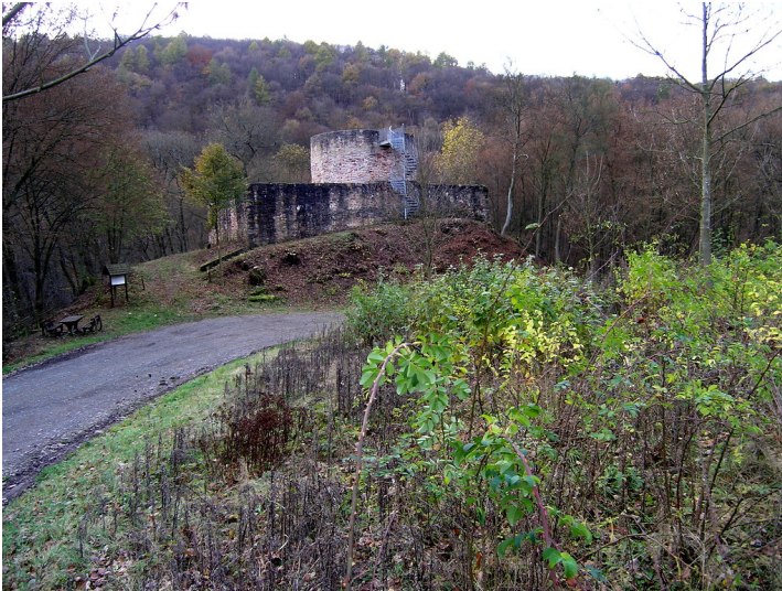
Die Burgruine Sprengelburg bei Oberweiler im Tal von Osten (2004).