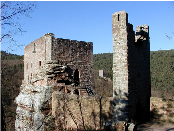
Pallas und neuere Schildmauer von Südosten