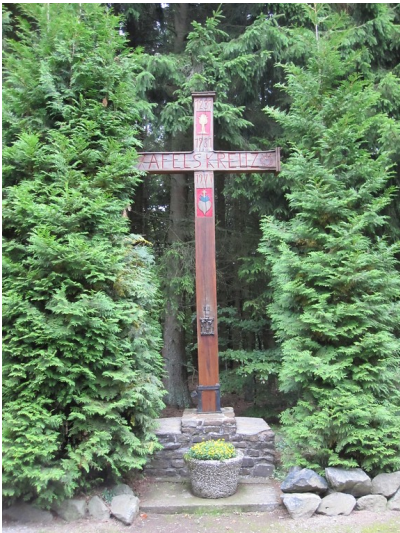
Afelskreuz in Katzwinkel (2010)