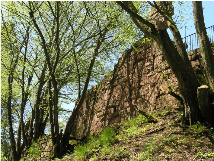
Burgruine Wilenstein bei Trippstadt: Wohnbaureste der hinteren Burg (2005).