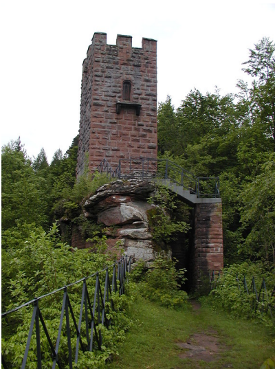
Burgruine Erfenstein bei Esthal: Bergfried auf dem Aufsatzfelsen (2003).