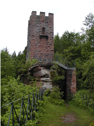
Burgruine Erfenstein bei Esthal: Bergfried auf dem Aufsatzfelsen (2003).