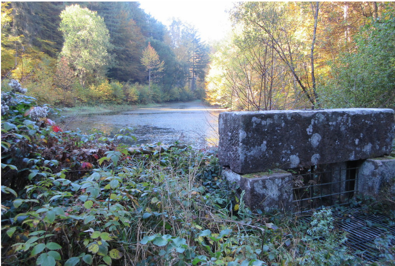
Peterswoog am Storbach (2018)