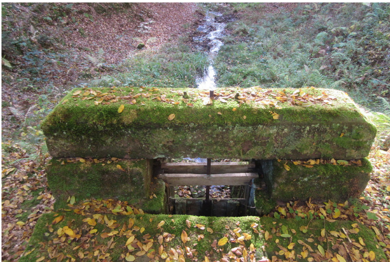
Philippswoog-Absperrbauwerk zur Holztrift am Storbach (2018)